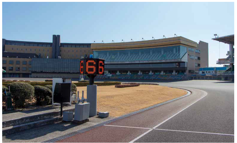
▲周回表示盤【川口オートレース場】