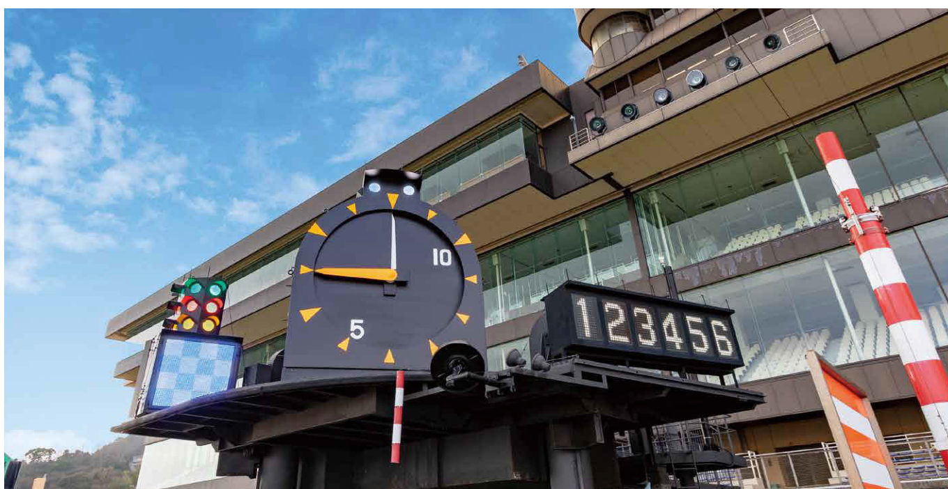
▲発走台「スタート・ゴール灯」「3色信号灯」「発走信号用時計」「失格・欠場表示盤」【ボートレース児島】