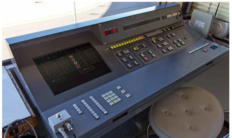
▲審判卓【川口オートレース場】