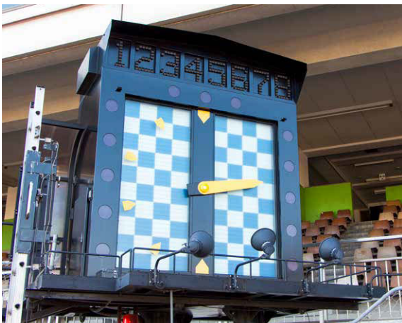
▲発走合図機(レース後)【川口オートレース場】