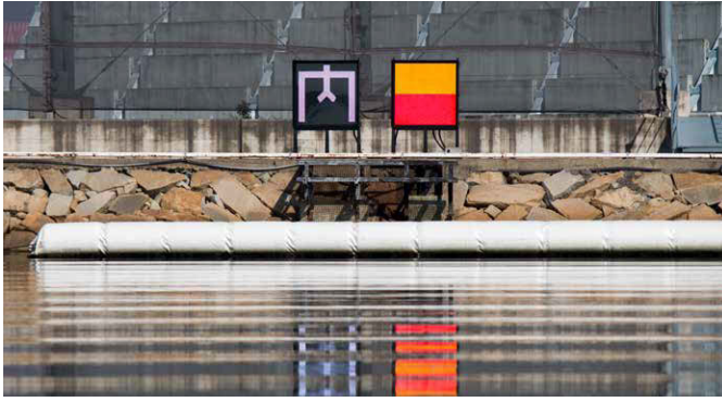
▲航走指示灯・危険信号灯【ボートレースまるがめ】