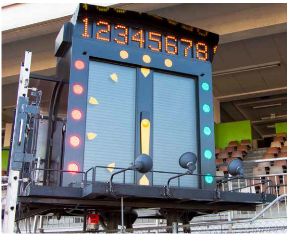
▲発走合図機(レース前)【川口オートレース場】