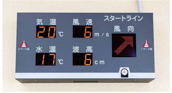
▲風向・風速・気温LED表示盤【ボートレース鳴門】