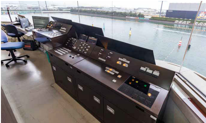
▲審判操作卓【ボートレース下関】